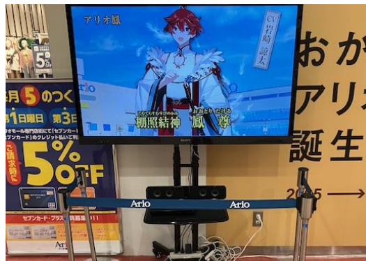
③ 55インチ /横小型/非固定式