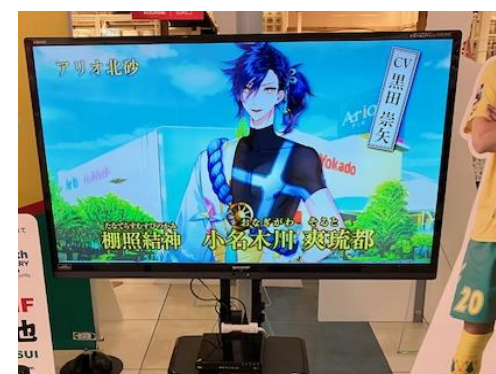
④ 60インチ /横小型/非固定式