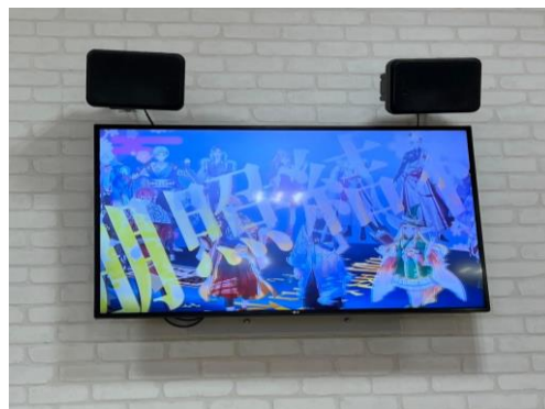
② 47インチ /横小型/固定式