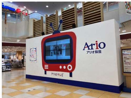
① 49インチ×4/横大型/固定式